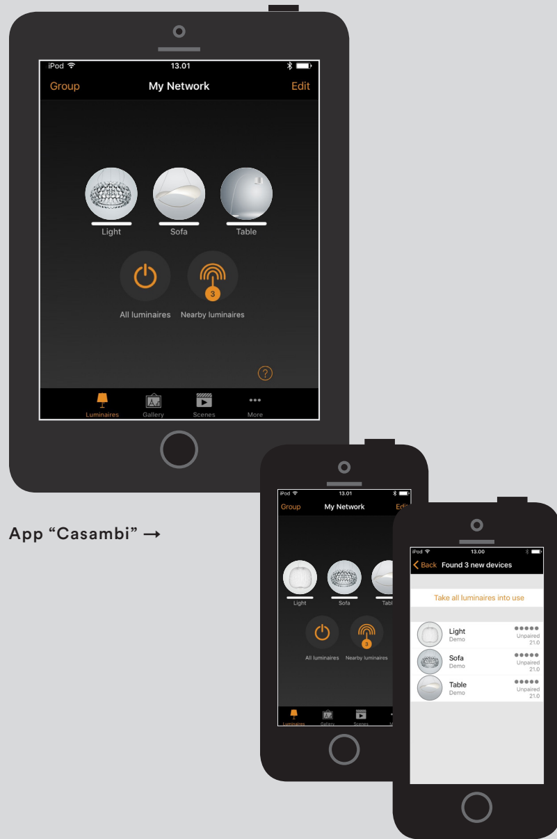
App "Casambi" →

IT → Foscarini My Light è il sistema intelligente di controllo e personalizzazione della luce pensato per le tue diverse esigenze di utilizzo.